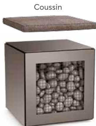
Accumulateur de chaleur 50 x 50 x 50 cm

Une box accumulateur équipée de galets emmagasine la chaleur pendant le temps de chauffe afin de la restituer progressivement pendant plus de 8h après l'arrêt du poêle, contre seulement quelques heures pour une cheminée ou poêle à bois classique.