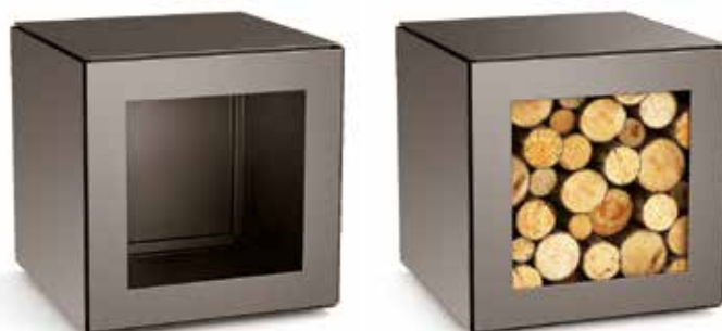
Rangement 50 x 50 x 50 cm

Une box de rangement a été spécialement optimisée pour le stockage du bois de chauffe. Utilisée en tabouret agrémenté d'un coussin ou comme étagère ou bibliothèque dans une composition de plusieurs modules, cette box peut également accueillir vos livres et vos objets préférés.